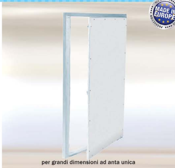
per grandi dimensioni ad anta unica

Sportello da 12,5 mm adattabile a pareti in gesso rivestito fino ad uno spessore di 25 mm.