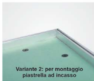
Variante 2: per montaggio piastrella ad incasso