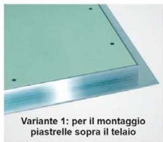
Variante 1: per il montaggio piastrelle sopra il telaio