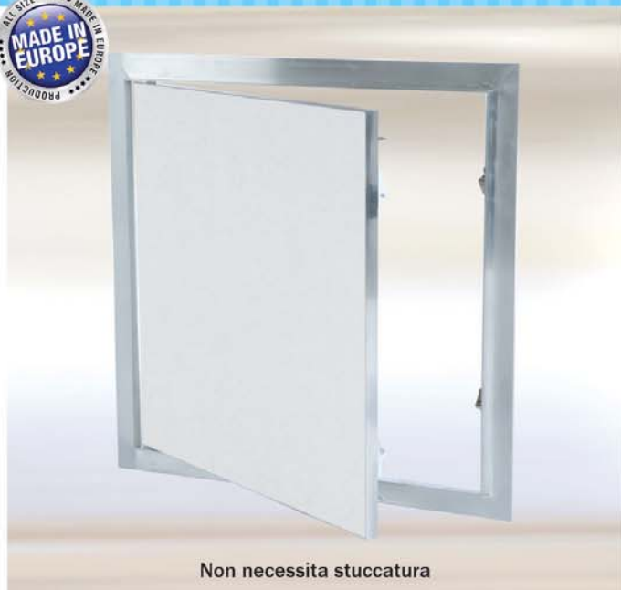
Non necessita stuccatura